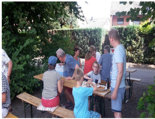
Hier wird das Gegrillte verspeist und genossen