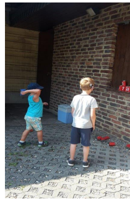
Dosenwerfen ist super